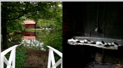
”Bergslagen made Sweden” - ett uttryck att samlas kring

Ett av våra verksamhetsområden kallar vi för Kommunikationer och Infrastruktur där vi bevakar Bergslagens intressen och verkar för goda kommunikationer och en väl utbyggd infrastruktur för våra invånare och företag.